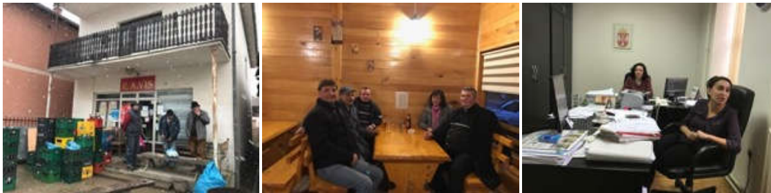
Slika 2. Sastanci sa vlasnicima zemljišta i opštinskim vlastima, 27. i 28. decembra 2016.