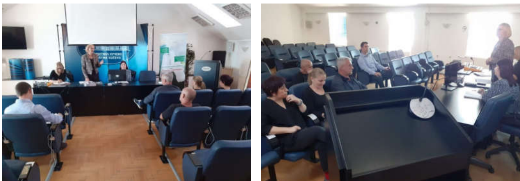
Slika 6. Sastanci sa organima lokalne uprave opštine Kučevo za provođenje procedure 21.10.2022.

U cilju nastavka dobre prakse, predlozi organa lokalne samouprave odnosili su se na predupređivanje eventualnih problema na terenu, odnosno u zonama izvođenja radova i to: