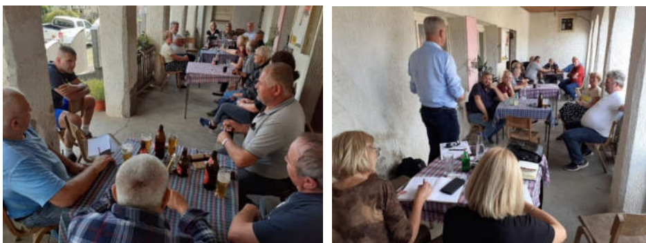
Slika 5. Sastanci sa meštanima sela Rakova bara 09.09.2022.

21. oktobra 2022. godine u prostorijama opštinske uprave opštine Kučevo održan je sastanak sa organima lokalne uprave opštine Kučevo za provođenje procedure. Organi lokalne uprave opštine Kučevo detaljno su upoznati sa Projektom VE „Krivača“. Organ zadužen za izdavanje građevinskih dozvola u nadležnosti lokalne samouprave bez problema provodi procedure i saraduje sa nadležnim organom za životnu sredinu. Konstatovano je da su svi objekti za koje se izdaju građevinske dozvole na lokalnom nivou obuhvaćeni Studijom o proceni uticaja na životnu sredinu (EIA). Utvrđeno je da organ lokalne samouprave već sada priprema i procedure za prenos lokalne putne infrastrukture u nadležnost lokalne samouprave u cilju efikasnog završavanja postupka. Saglasni su i da se pojedinačni nedostaci i zastoji u procedurama pred nadležnim organima i institucijama brzo otklanjaju i ne remete postupke objedinjene procedure. Takođe, saglasni su da se svi eventualni poremećaji na terenu brzo