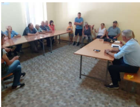
Slika 3. Sastanci sa vlasnicima zemljišta u sela Krivača 27.07.2022.

08. avgusta 2022. godine u selu Dvorište, održan je sastanak u prostorijama mesne zajednice. Sastanak je održan sa konsultantima za rešavanje socijalnih pitanja i životne sredine angažovanim od strane Ivicoma, predstavnikom Ivicoma i meštanima ovog sela. Razmatrana pitanja i problemi stanovnika ovog sela koji se javljaju prilikom izgradnje putne infrastrukture za planirani vetropark „Krivača“. Na sastanku je prisustvovalo 16 vlasnika ekspropisanog zemljišta, koji su svoju zemlju dali za potrebe realizacije Projekta. Saslušani stanovnici saglasni