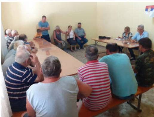
Slika 4. Sastanci sa vlasnicima zemljišta u sela Dvorište 08.08.2022.

09. septembra 2022. godine, predstavnik Ivicoma sa konsultantima za rešavanje socijalnih pitanja i životne sredine obišli su stanovnike sela Rakova bara sa kojima je održan sastanak. Sastanak je održan ispred mesne zajednice gde su saslušani svi prisutni. Od strane meštana sela Rakova bara pokazano je veliko interesovanje za otvaranje i početak rada VE „Krivača“. Stanovnici su još jednom upoznati sa planiranim aktivnostima na teritoriji njihove opštine i sa nestrpljenjem se očekuje izgradnja puteva na teritoriji sela Rakova Bara. Nije bilo pritužbi na dosadašnji odnos investitora prema zajednici i pojedincima.