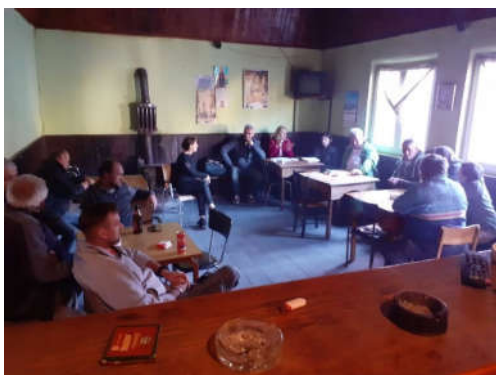
Slika 7. Sastanci sa meštanima sela Krivača 10.11.2022.