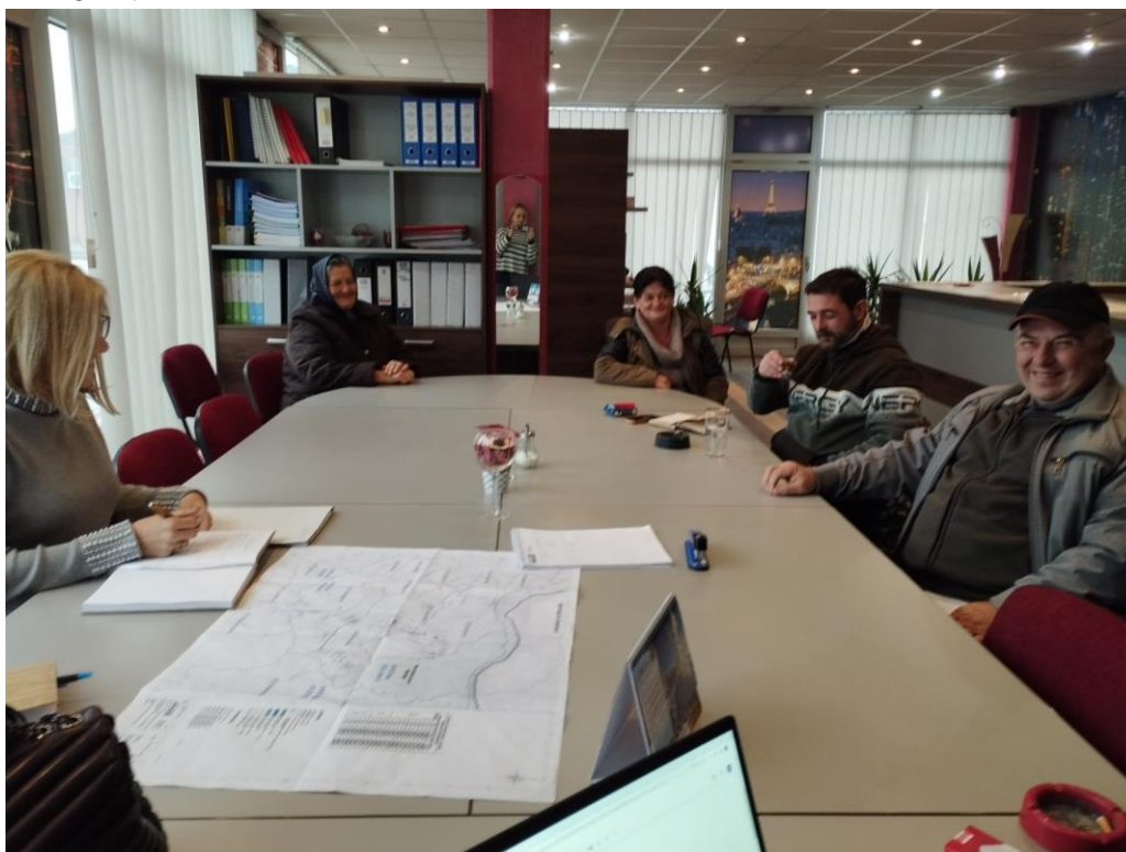
Fotografije sa sastanka